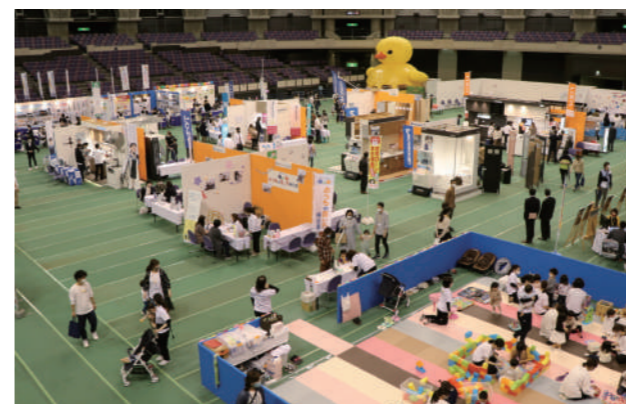
グループ会社合同イベントin鹿児島アリーナ▲