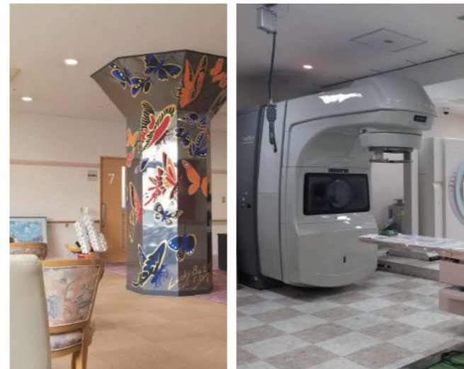
▲オンコロジークリニック内