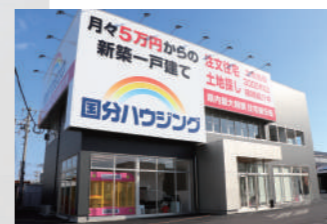
鹿児島店(鹿児島県宇宿)▲