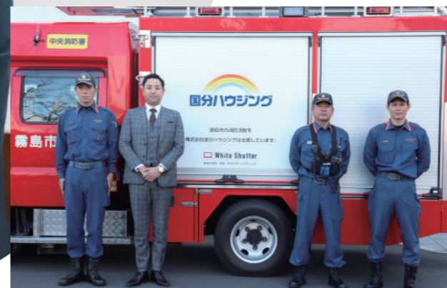
全国初!ホワイトシャッタープロジェクト▲