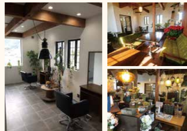
▲1階：美容室(左) 2階：カフェ(右上)と雑貨屋(右下)の複合店舗

コロナが蔓延し始めた頃はとにかく不安でした。外に出ないのでお客さんも来れなくなってしまって、従業員も正社員も居るのに妻と毎日が怖かったのを覚えていますし、今も不安なところは感じます。コロナ禍を受けてカフェではテイクアウトを始め、多くのお客様にご注文頂きとても有り難かったです。またその環境下ですとがんばってくれた従業員には本当に感謝しています。