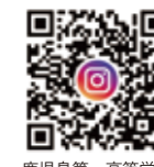
鹿児島第一高等学校